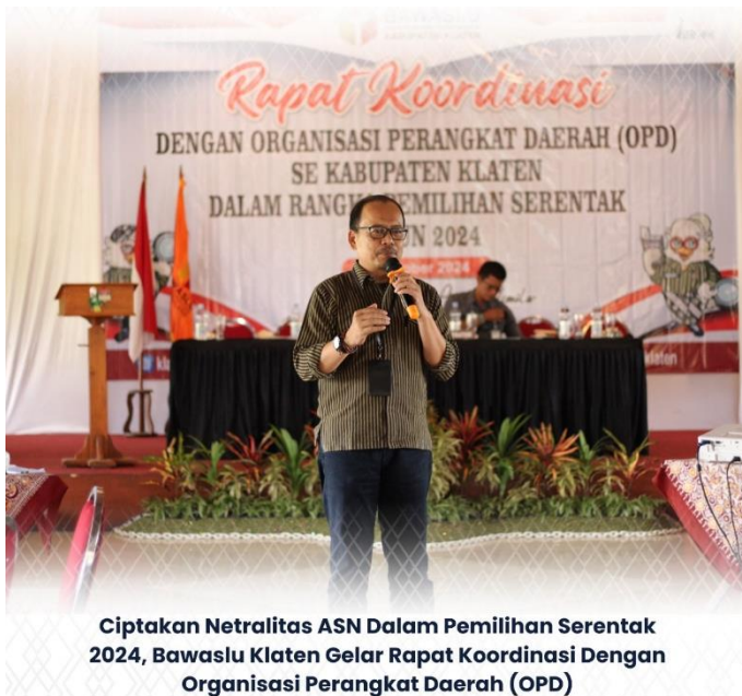
Ciptakan Netralitas ASN Dalam Pemilihan Serentak 2024, Bawaslu Klaten Gelar Rapat Koordinasi Dengan Organisasi Perangkat Daerah (OPD)