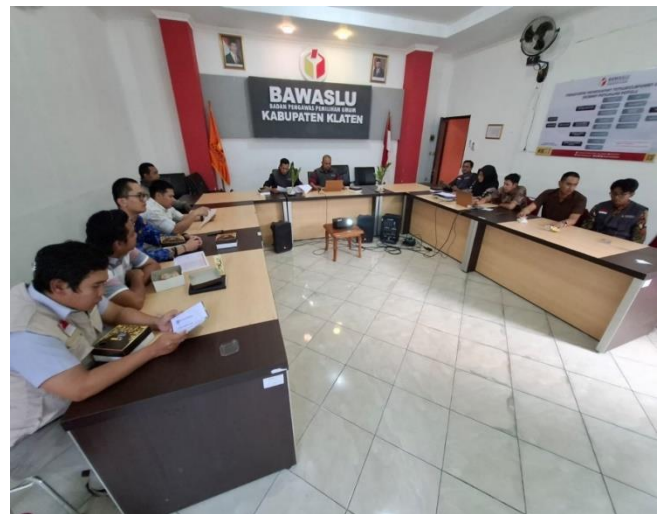
Rapat Sentra Gakkumdu