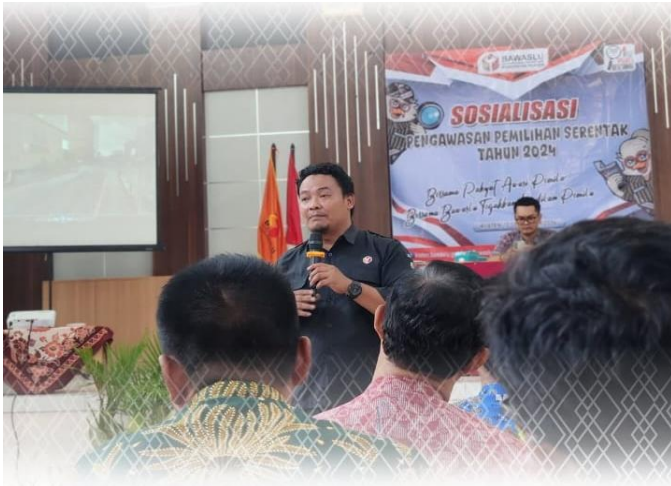
Ajak Pemilih Pemula, Tokoh Masyarakat & Perwakilan OSIS SMA, SMK & MA Se Klaten Awasi Pemilihan 2024, Bawaslu Gelar Sosialisasi Pengawasan Partisipatif Kamis, 12 September 2024