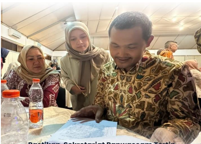
Pastikan Sekretariat Panwascam Tertip Administrasi Bawaslu Klaten Periksa Laporan Pertanggungjawaban Pengeluaran Keuangan