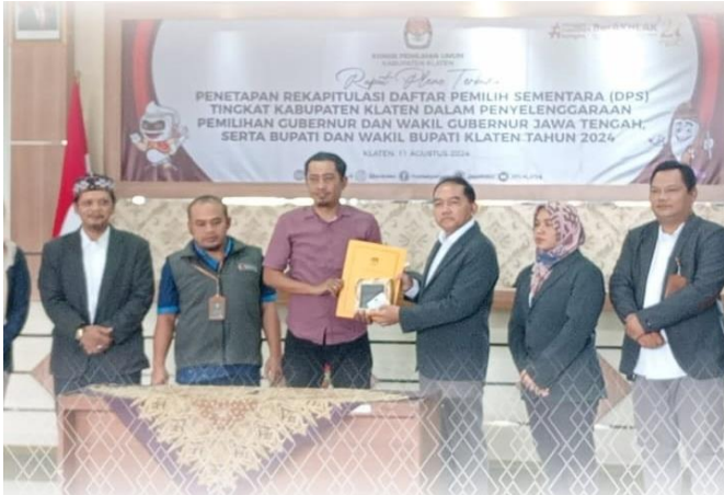
Daftar Pemilih Sementara Pemilihan 2024 Ditetapkan KPU, Bawaslu Hadiri Dan Komitmen Terus Mengawal Sampai Dengan Daftar Pemilih Tetap