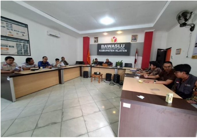
Rapat Sentra Gakkumdu