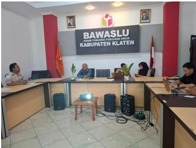
Rapat Sentra Gakkumdu