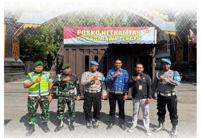
Bawaslu Klaten, Polres Klaten Dan Kodim 0723 Klaten Siap Terima Laporan Dugaan Pelanggaran Di Posko Netralitas Pilkada Jawa Tengah Klaten, 01 Oktober 2024