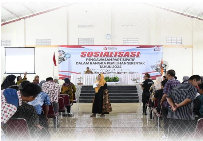
Menjelang Hari Tenang Pemilihan 2024, Bawaslu Klaten Gelar Sosialisasi Pengawasan Partisipatif Pada Hari Tenang Pemilihan 2024 Klaten, 22 November 2024