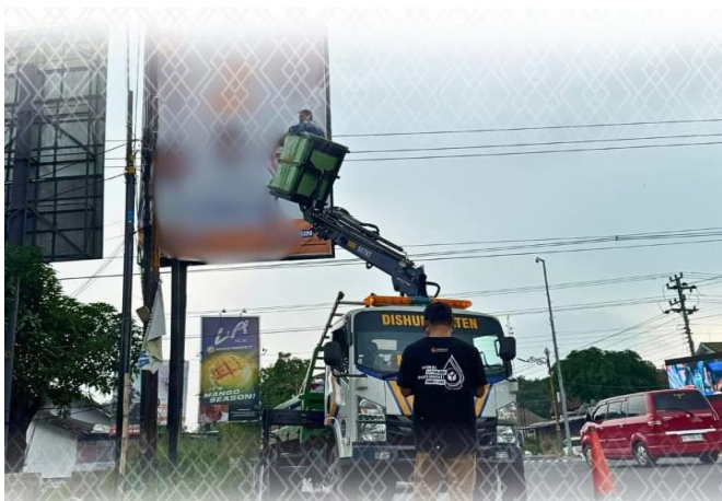
Sudah Masuk Masa Tenang Pemilihan 2024, Bawaslu Bersama Tim Gabungan Tertibkan Alat Peraga kampanye (APK) Klaten, 24 November 2024