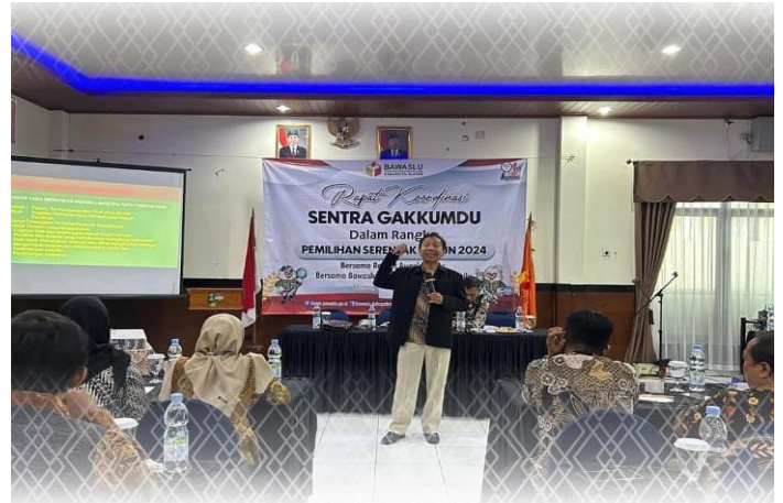
Bawaslu Klaten Gelar Rapat Koordinasi Sentra Gakkumdu Dalam Rangka Pemilihan Serentak Tahun 2024