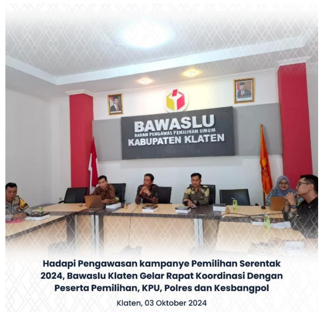
Hadapi Pengawasan kampanye Pemilihan Serentak 2024, Bawaslu Klaten Gelar Rapat Koordinasi Dengan Peserta Pemilihan, KPU, Polres dan Kesbangpol Klaten, 03 Oktober 2024