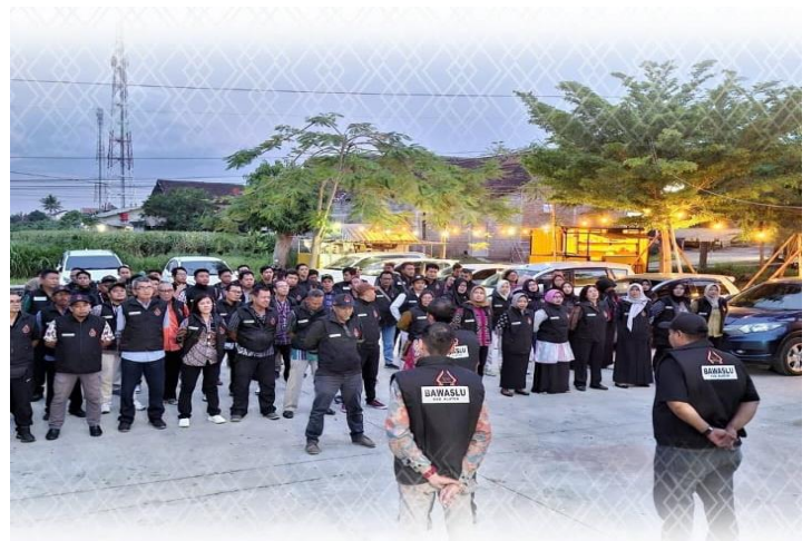
Mendekati Hari Tenang Pemilihan 2024 Bawaslu Klaten Gelar Apel Siaga Pengawasan Pemilihan Serentak Tahun 2024 Klaten, 23 November 2024