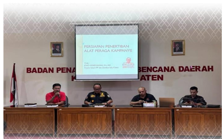
Alat Peraga Kampanye Pemilihan 2024 Akan Segera Ditertipkan, Bawaslu Gelar Rapat Koordinasi Penertiban Alat Peraga Kampanye Klaten, 22 November 2024