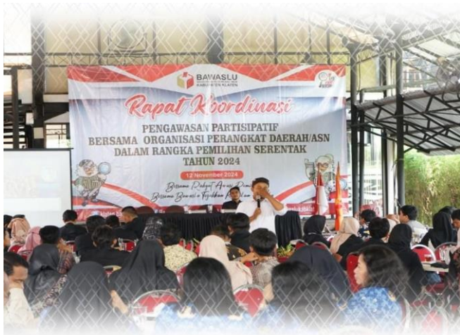
Pastikan Aparatur Sipil Negara Netral Di Pilkada 2024 Bawaslu Gelar Rakor Pengawasan Partisipatif Bersama OPD/ASN Se Kab. Klaten Klaten, 12 November 2024