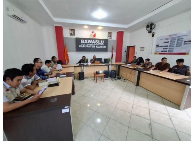
Rapat Sentra Gakkumdu