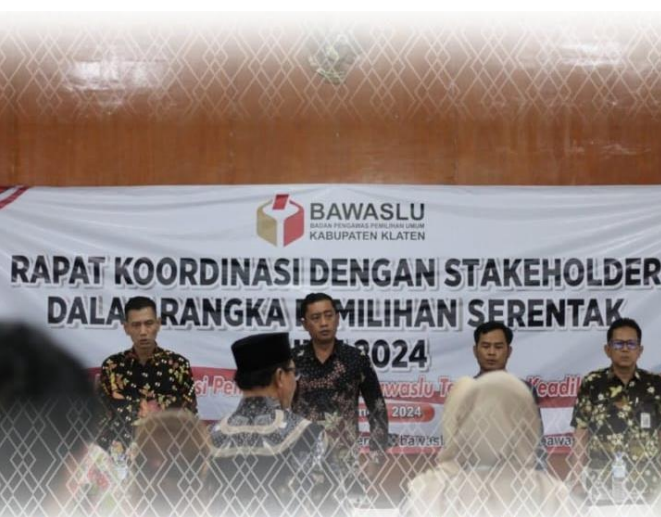
Ajak Stakeholder Ikut Serta Awasi Pemilihan 2024, Bawaslu Gelar Rapat Koordinasi Pengawasan Partisipatif Bersama Stakeholder