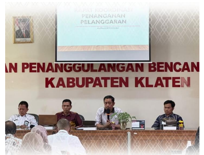
Hadapi Pengawasan Kampanye Pemilihan Serentak Tahun 2024, Bawaslu Gelar Rapat Koordinasi Penanganan Pelanggaran Bersama Panwascam