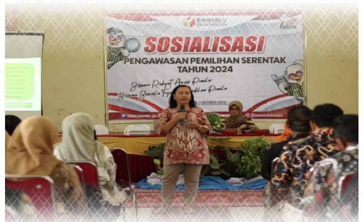
Tingkatkan Peran Masyarakat Dalam Pengawasan Partisipatif Pemilihan 2024, Bawaslu Gelar Sosialisasi Pengawasan Pemilihan Serentak 2024 Klaten, 02 Oktober 2024