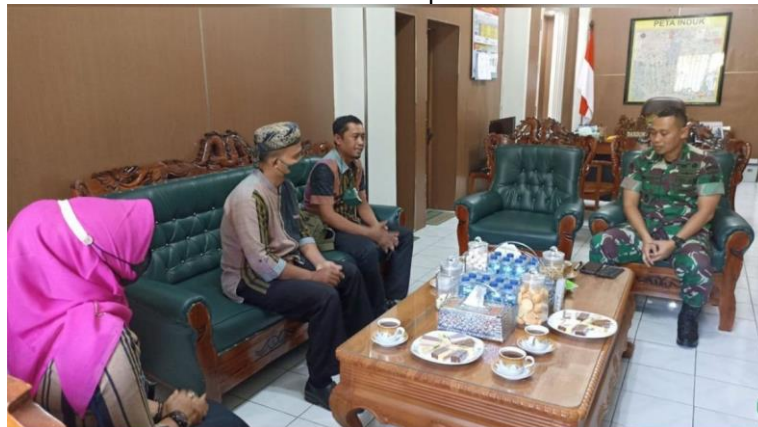
Gambar 2 Audiensi Bawaslu Kabupaten Klaten dengan Kodim 0273/Klaten