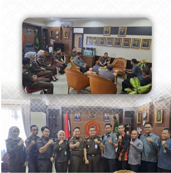
Gambar 3 Audiensi Bawaslu Kabupaten Klaten dengan Kejaksaan Negeri Klaten