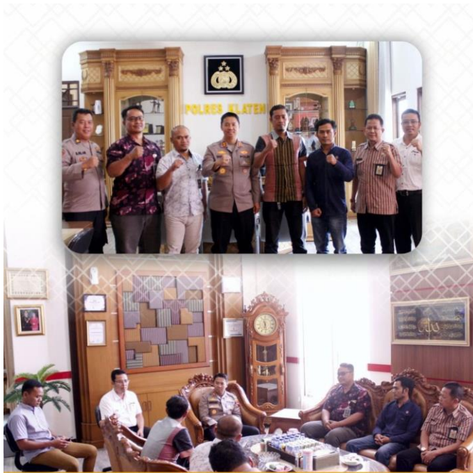
Gambar 4 Audiensi Bawaslu Kabupaten Klaten dengan Polres Kabupaten Klaten