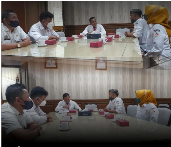
Gambar 1 Audiensi Bawaslu Kabupaten Klaten dengan Sekretariat Daerah Kabupaten Klaten

Bawaslu Kabupaten Klaten melakukan audiensi sebagai wujud koordinasi dengan stakeholder di Kabupaten memiliki tujuan agar selama tahapan pemilu 2024 dapat diwujudkan secara bersama-sama menciptakan pemilu yang adil, kondusif dan tidak memihak. Audiensi yang dilakukan Bawaslu Kabupaten Klaten dilakukan kepada Kapolres Klaten, Kejaksaan Negeri Klaten, Setda Klaten dan Kodim 0273/Klaten